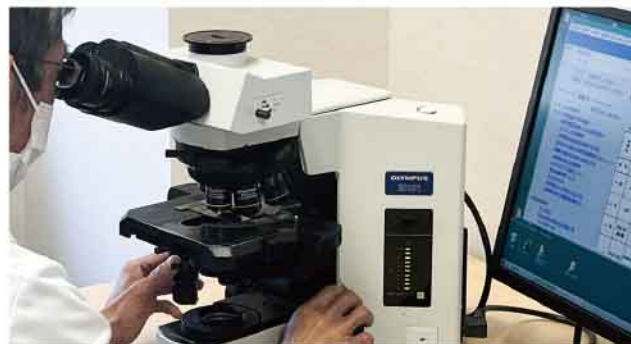
プレパラートを顕微鏡でみて癌かどうかを診断します