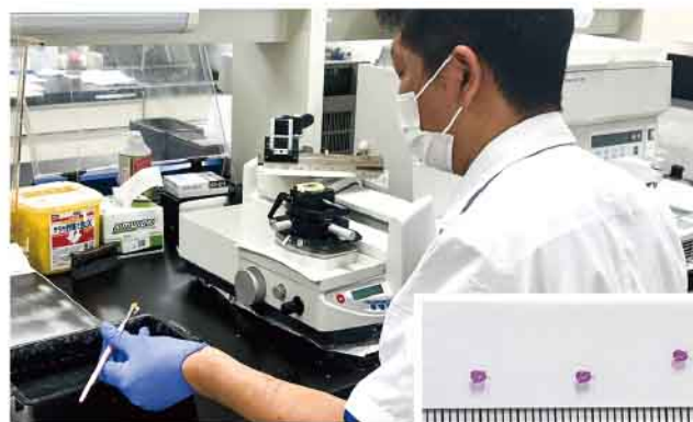
プレパラート作成風景

患者さんにとって良性病変と「がん」とでは天と地ほどの違いがあり、間違いは許されません。正確な診断を行うため、病理医や検査技師は日々研鑽を積んでいます。