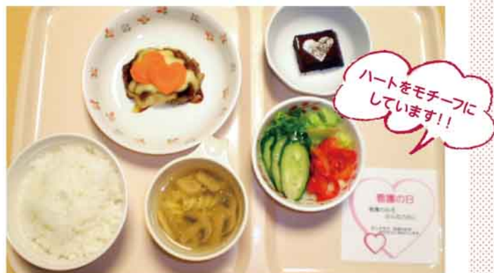
看護の日の特別メニュー

当院は、これからも皆様が地域で元気に暮らしていけるよう今後もイベントや入院・外来での関わりを通して支援していきたいと考えています。