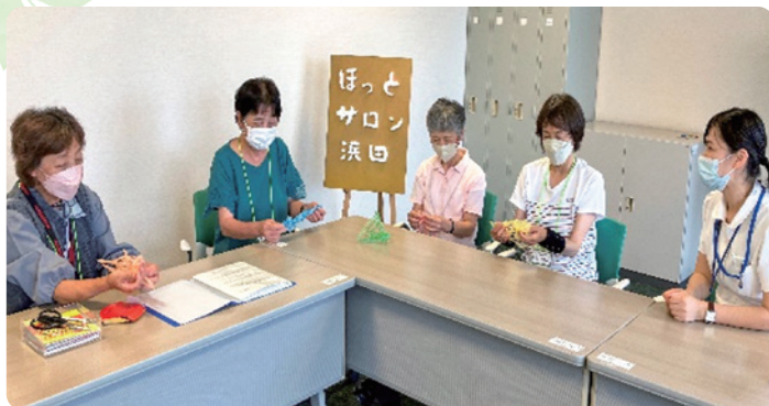
お話ししながらイベントの飾りを作成中♪