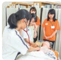
フィジカルアセスメント体験