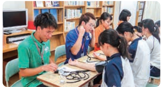
フィジカルアセスメント体験