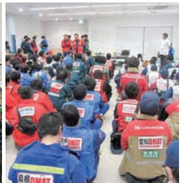
阿蘇医療センター本部