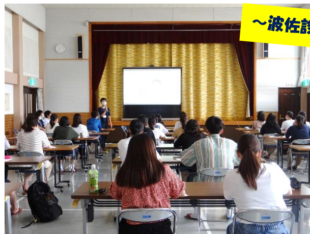
～波佐診療所の講話～