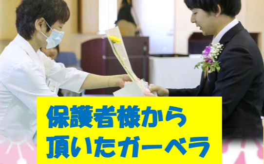
保護者様から 頂いたガーベラ