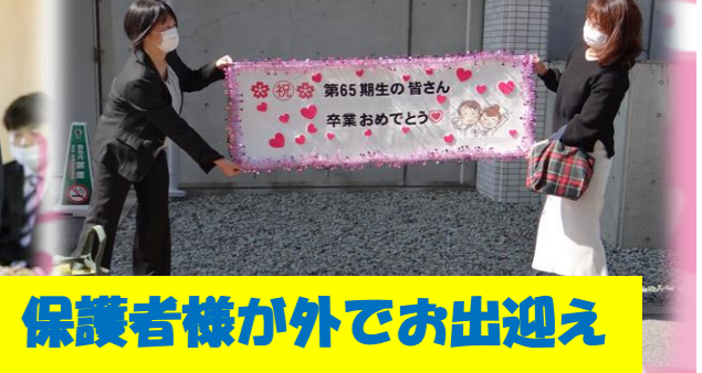
保護者様が外でお出迎え