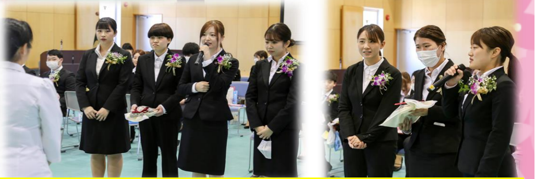
チューターの先生から「○○で賞」が送られました