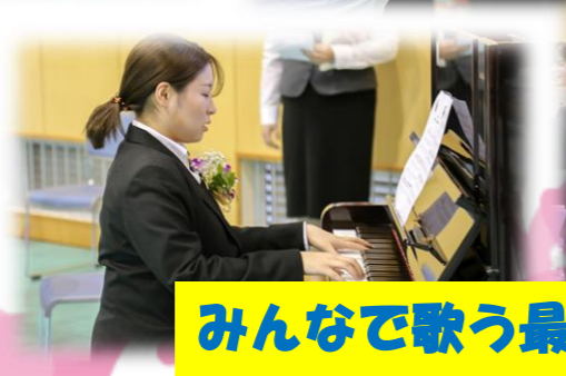
みんなで歌う最後の校歌