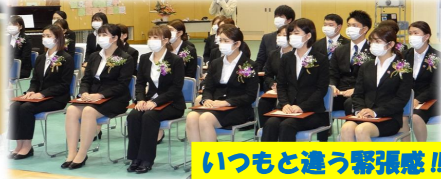
いつもと違う緊張感!!