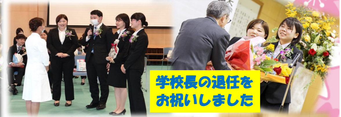
学校長の退任をお祝いしました