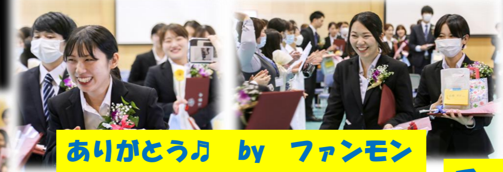
ありがとう♪ by ファンモン 未来に向かって歩み始めました